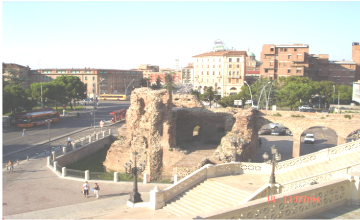
ماخذ: نویسنده، تاریخ عکس‌برداری، شهریور ۱۳۸۴