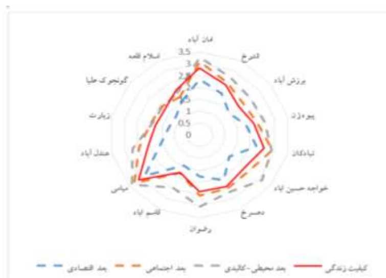
شکل ۳- رادار نقش گردشگری بر سازه کیفیت زندگی و ابعاد آن