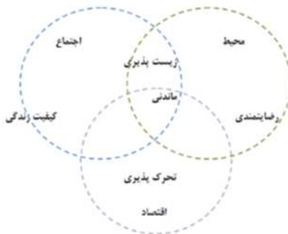
شکل ۲- مدل عوامل سهیم در کیفیت زندگی از دیدگاه اکولوژی انسانی

و پایداری (ماندنی) در ارتباط متقابل با همدیگر بیان شده است (وان کمپ، لیدرمرجر، میسون و دی هولاندر ۱ ، ۲۰۰۳، ص. ۱۱) که زیست‌پذیری نتیجه تأمین مطلوب محیطی و اجتماعی است و بیشتر از نظر زمانی، نگاه به حال حاضر دارد، اما پایداری بیشتر متأثر از جنبه‌های محیطی است که از نظر زمانی نگاه به آینده دارد. در واقع می‌توان حوزه‌های اجتماعی-محیطی-اقتصادی را به عنوان سه رکن اصلی کیفیت زندگی در نظر گرفت. لازم به ذکر است محققان و صاحب‌نظران متعددی کیفیت زندگی را در ابعاد اجتماعی، محیطی و اقتصادی مورد بررسی قرار داده‌اند. به عقیده مایرس ۲ کیفیت زندگی ریشه در کفایت اقتصادی، محیطی و الزامات اجتماعی دارد (مایرس، ۱۹۸۷، ص. ۱۵۱) و عبارت است از شرایط اجتماعی، فرهنگی، اقتصادی و کالبدی-فضایی (خواجه شاهکوهی، مینایی، ۱۳۹۳، ص. ۵) به رغم تکثرگرایی مفهومی و عملیاتی، کیفیت زندگی عموماً یک مفهوم چندبعدی است (مک‌گیلوری ۳ ، ۲۰۰۶، ص. ۴۱) که با توسعه اقتصادی-اجتماعی و بهبود و بهسازی سطوح زندگی اهمیت می‌یابد و ویژگی‌های کلی اجتماعی، اقتصادی محیط در یک ناحیه را نشان می‌دهد (محمدپورجباری، ۱۳۹۳، ص. ۳۸) (شکل ۲).