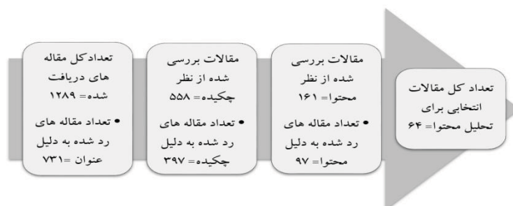
شکل ۲. فرآیند انتخاب مقالات