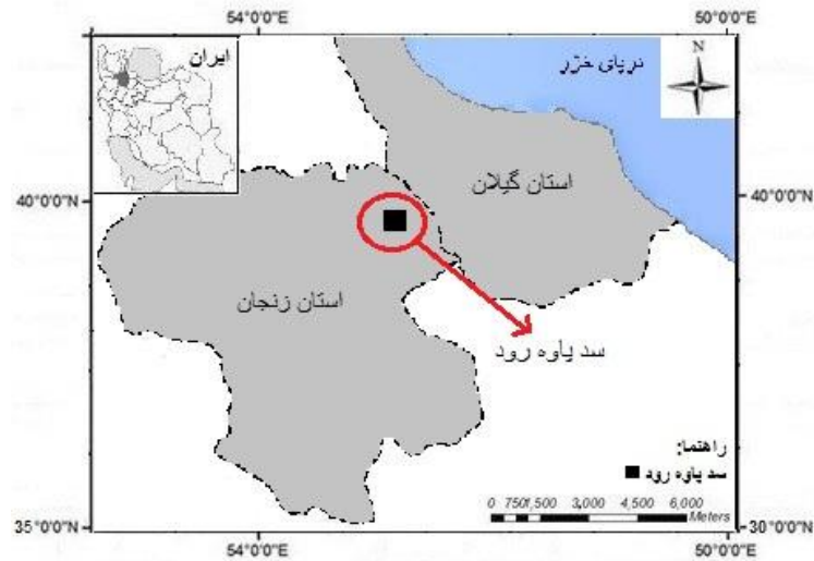
شکل ۱. موقیت مکانی سد پاورود زنجان