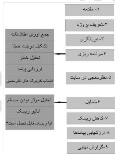
شکل ۳. فرآیند ارزیابی ریسک در سدها به‌روش RAM-D [۱۳]

روش RAM-D از روش تحلیل درخت خطا بهره می‌گیرد و اطلاعات مورد نیاز را از متخصصان، منابع موجود و سایت‌های اینترنتی فراهم می‌کند و طرح و نقشه اولیه سدها به‌شدت بستگی به این موارد دارد. RAM-D فرآیند زنده و پویا است که با تغییر محیط تهدید نیاز به بازبینی و تغییر دارد [۱۳]. در شکل ۳ مراحل اجرای ارزیابی ریسک به‌روش RAM-D نشان داده شده است.