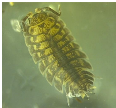
شکل ۴: شکل کلی گونه Trachelipus pieperi

مواد بررسی شده: ۳ نمونه (♂، ♀)، ایران، استان مازندران، ساری، جنگل سمسکنده، طول جغرافیایی ۵۳° ۹' ۲۵" شرقی تا ۵۵° ۳۲' ۳۶" شمالی. تعداد شمارش شده: ۹۰ عدد