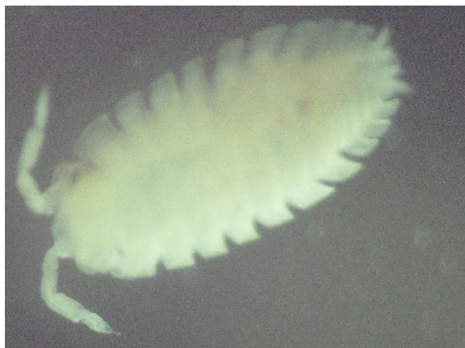
شکل ۳: شکل کلی گونه Brevurus masandaranus : نمای پشتی (سمت راست) و نمای شکمی (سمت چپ)

پراکنش گونه: این گونه تنها از ایران و استان مازندران گزارش شده است. توصیف گونه: اندازه بالغ این جورپا تقریباً بزرگ و در حدود ۲/۵ تا ۲/۷ سانتی‌متر می‌رسد. رنگ آن تیره و قهوه‌ای رنگ است. روی بدن لکه‌های زرد رنگ وجود دارد (شکل ۴).