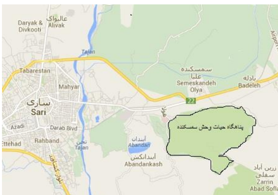
شکل ۱: نقشه مکانی پناهگاه حیات وحش سمسکنده