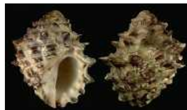
شکل ۲: نمونه ای از شکم‌پای تاییس

نتایج به دست آمده از تعیین پروفیل اسیدهای چرب گونه تاییس در دو فصل گرم و سرد در منطقه بین جزر و مدی عسلویه در جداول ۲ و ۳ آمده است.