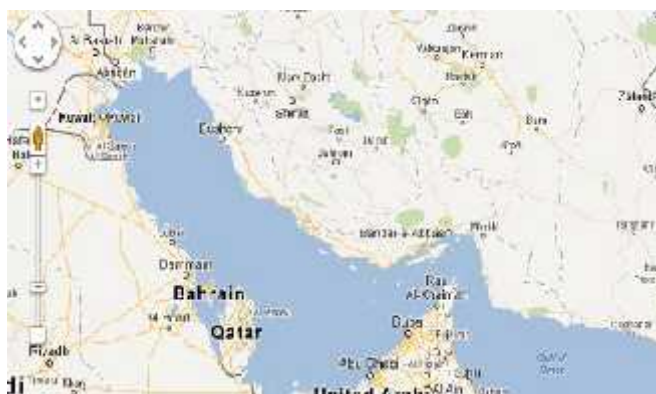
شکل ۱: (الف) موقعیت جغرافیایی خور هاله و خلیج نابیند

موقعیت و ملاحظات امنیتی انتخاب شدند. سپس با توجه به شباهت و نزدیکی دو مورد از ایستگاه‌ها، تعداد نقاط نمونه‌برداری به شش ایستگاه کاهش یافت. در زمان نمونه‌برداری نیز محل دقیق ایستگاه‌ها با استفاده از GPS مشخص گردید. پس از جمع‌آوری نمونه‌ها جداسازی گوشت از پوسته در محل انجام شد و در دمای ۲۰- درجه سانتی‌گراد فریز شده و به سرعت با هواپیما به آزمایشگاه مرکز ملی اقیانوس‌شناسی منتقل گردید. آنالیز محتوی اسیدهای چرب توسط روش کروماتوگرافی گازی جرمی انجام شد. بدین منظور ابتدا گوشت هر ۱۰۰ عدد نمونه در هر فصل به طور همگن با یکدیگر مخلوط شد و سپس ۳ زیر نمونه (۳ تکرار) به وزن ۵ گرم (وزن تر) از کل نمونه با نسبت ۲:۱ حجمی کلروفورم متانول به نسبت ۲۰:۱ مخلوط و هموزن شد. سپس محلول را صاف کرده و به محلول صاف شده ۵۰ میلی‌لیتر آب و ۰/۵٪ (۰/۲۵ گرم) نمک طعام اضافه شد. فاز زیرین (کلروفورمی) جدا شده و استخراج با نرمال هپتان/دی‌اتیل اتر انجام گردید. این محلول تبدیل به متیل استر شده و برای تزریق به دستگاه GC/MS آماده‌سازی شد (Joseph، ۱۹۸۲؛ Johns و