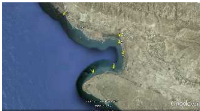
شکل ۱: (ب) موقعیت شش ایستگاه منتخب برای نمونه برداری از شکم‌پای تاییس ۱,۵۰۰۰۰ Google earth, NOAA, USA Navy, NGA