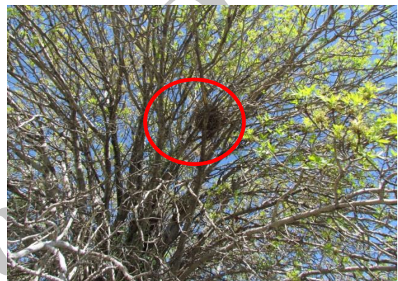
شکل ۲: لانه کبوتر جنگلی در منطقه حفاظت شده باغ شادی خاتم، بهار ۱۳۹۳

جنگلی و ۲۰ نقطه کنترل به‌دست آمد. سطح تاج پوشش درختان با کمک سطح سایه‌انداز درخت محاسبه شد. بدین ترتیب که با توجه به استقرار تمام ۲۰ آشیانه بر روی درختان بنه ( Pistachia sp ) و مدور بودن تاج پوشش این درختان، ابتدا میانگین قطر سطح سایه‌انداز درخت در جهات مختلف اندازه‌گیری و از فرمول مساحت دایره S=3.14 r^2 استفاده گردید (عرفانی‌فرد و موصول، ۱۳۹۲). ارتفاع درختان با استفاده از یک شاخص مدرج محاسبه شد. برای به‌دست آوردن فاصله آشیانه‌ها تا نزدیک‌ترین منبع آبی و جاده بعد از ثبت مختصات با کمک GPS از نرم‌افزار Arc GIS نسخه ۱۰/۳ استفاده شد.