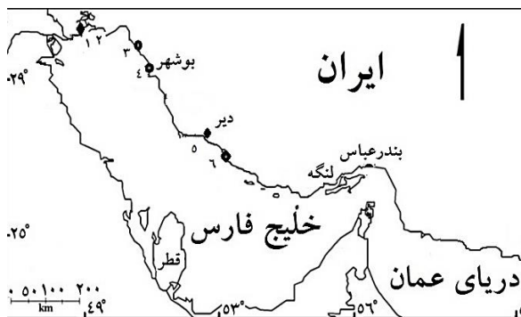
شکل ۱. مناطق نمونه‌برداری از ماهی شوریده در خلیج فارس (۱. خورموسی، ۲. هنديجان، ۳. گناوه، ۴. بوشهر، ۵. دیر و ۶. عسلویه)

نمونه‌گیری: منطقه مورد بررسی در این پژوهش آب‌های ساحلی ایران در خلیج فارس شامل خورموسی، هنديجان، گناوه، بوشهر، دیر و عسلویه (شکل ۱) بود. از ماهیان صید شده توسط قایق‌های صیادی به‌میزان یک تا دو گرم از بافت ماهیچه جداسازی گردید و با ذکر محل نمونه‌برداری، بلافاصله در الکل ۹۶ درصد تثبیت و به آزمایشگاه منتقل گردید.