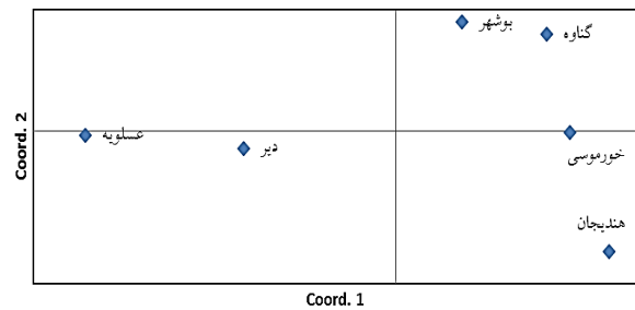
شکل ۳. رابطه میان شش جمعیت ماهی شوریده با استفاده از تجزیه مولفه‌های اصلی

(مولفه اول و دوم مجموعاً ۱۸ درصد اختلاف ژنتیکی را دربر می‌گیرند)