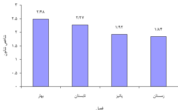
شکل ۲: نمودار شاخص شاخه شانون (H) فیتوپلانکتون در فصل‌های مختلف

مترمکعب \times 10^6 و کمترین زی توده نیز در زمستان 129/7 \pm 50 میلی گرم در مترمکعب مشاهده شد (جدول ۴).