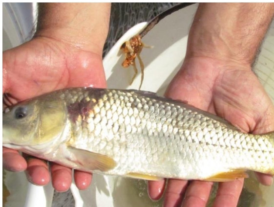
شکل ۶: زخم های جلدی شدید در ماهی آلوده