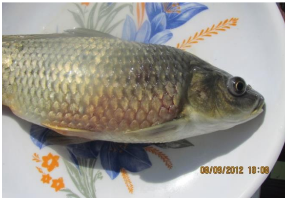
شکل ۵: خونریزی شدید جلدی در ماهی آلوده