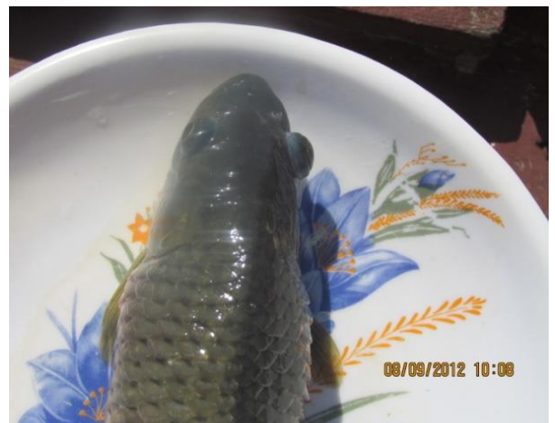
شکل ۳: خونریزی در محوطه بطنی ماهی مبتلا به آئروموناس