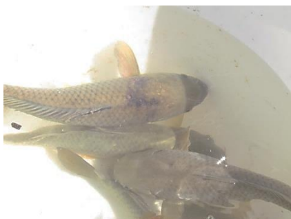
شکل ۸: زخم های شدید جلدی در ماهی آلوده