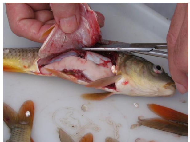
شکل ۴: اگزوفتالمی شدید در ماهی آلوده به آئروموناس