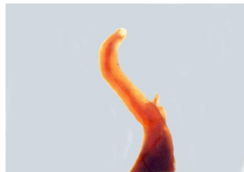
شکل ۴: Skrjabinopsolus semiarmatus (ناحیه قدامی شامل بادکش های دهان و شکمی) از مولدین تاس ماهی ایرانی صید شده در سواحل جنوب شرقی دریای خزر با میکروسکوپ نوری با رنگ آمیزی کارمن اسید (حق پرست و همکاران، ۱۳۸۵)

این محقق هم چنین نشان داد که تفاوت معنی داری بین شیوع انگلی در جنس نر و ماده وجود دارد. تحقیقی نیز توسط ستاری (۱۳۷۸) بر روی انگل های کرمی تاس ماهی ایرانی انجام گرفت که ۲ گونه آنیزاکیس Sp. و استرونکلیدیس اگزوسیوس از نمونه های قره برون سواحل غرب را شناسایی و گزارش نمود که هیچ کدام در بررسی های سال های ۱۳۸۴ تا ۱۳۹۶ مشاهده نشد. Masoumzadeh و همکاران (۲۰۰۵)، در تحقیقی بر روی مولدین تاس ماهی ایرانی در سواحل جنوب شرقی دریای خزر انجام داده و ۴ نوع انگل شناسایی نمودند که دو گونه نادر آن Eubothrium acipenserium و Corynosoma strumosom معرفی گردید که در تحقیقات حاضر مشاهده نشد. در سال ۲۰۰۳، انگل کرمی داخلی همانند