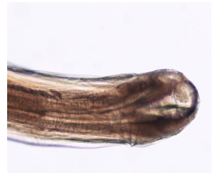
شکل ۱: قسمت قدامی انگل Cucullanus sphaerocephalus جدا شده از دستگاه گوارش تاس ماهی ایرانی صید شده در سواحل جنوب شرق دریای خزر در سال ۱۳۹۶