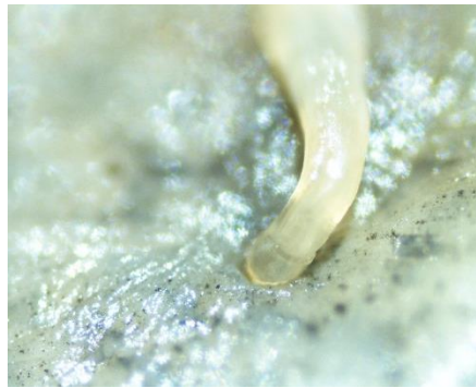
شکل ۴: نمونه انگل Cucullanus sphaerocephalus بافت دستگاه گوارش تاس ماهی ایرانی صید شده در سواحل جنوب شرق دریای خزر در سال ۱۳۹۶