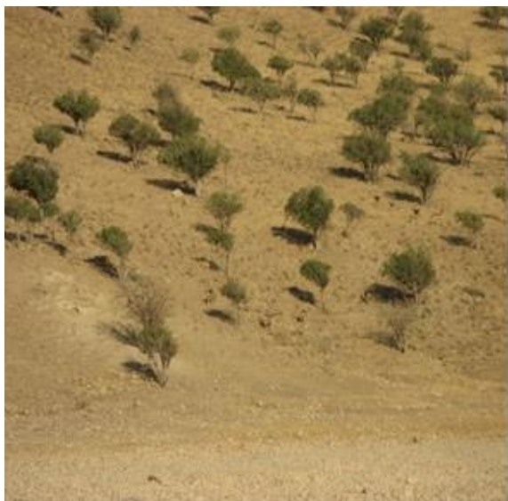
شکل ۳: سیمای تابستانه زیستگاه گوزن زرد ایرانی در جزیره اشک، پارک ملی دریاچه ارومیه (تابستان ۱۳۹۰)

به دو لپه‌ای‌ها می‌باشد (زهزاد، ۱۳۶۸). لذا با توجه به عدم مشخص بودن و وجود نقشه تیپ‌های گیاهی تصمیم گرفته شد که جزیره بر اساس شیب و وجود آب به چهار زیستگاه تقسیم شود. که این چهار زیستگاه عبارتند از: مناطق دشتی، دامنه پرشیب و سنگلاخی، چشمه و دامنه شرقی، دامنه شمالی. و بر این اساس پلات‌های نمونه‌برداری در زیستگاه‌های مختلف به صورت تصادفی - سیستماتیک پراکنده شدند.