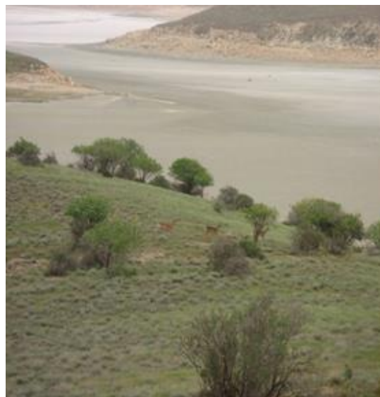
شکل ۲: سیمای بهاره زیستگاه گوزن زرد ایرانی در جزیره اشک، پارک ملی دریاچه ارومیه (بهار ۱۳۹۰)

مشخص نمودن تیپ‌های پوشش گیاهی و یا زیستگاه‌های موجود در جزیره اشک: اما بر طبق پژوهش انجام شده در ۱۳۶۸، فلور این جزیره مشتمل بر ۱۹۸ گونه متعلق به ۱۴۹ جنس از ۴۶ خانواده بوده است، که ۱٪ گونه‌ها باز دانه، ۱۴٪ تک لپه و ۸۵٪ متعلق