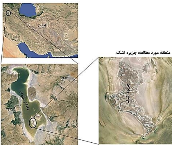
شکل ۱: تصویر ماهواره‌ای منطقه مورد مطالعه (جزیره اشک)، موقعیت در کشور و دریاچه ارومیه

منطقه مورد مطالعه: با توجه به این که این پژوهش در سال‌های خشک دریاچه ارومیه انجام شد وسعت این جزیره با استفاده از نقشه ۱:۵۰۰۰۰ جزیره اشک که از سازمان جغرافیایی نیروهای مسلح تهیه شد در حدود ۲۹ کیلومترمربع (۲۹۰۰ هکتار) در نظر گرفته شد.