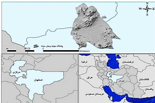
شکل ۱: موقعیت جغرافیایی پناهگاه حیات وحش موته در استان های اصفهان (شاهین شهر) و مرکزی (دلیجان)

منطقه حفاظت شده در استان اصفهان است. از مهم ترین تهدیدات این منطقه علاوه بر وجود سکونتگاه های شهری و روستایی و معدن کاری در داخل منطقه، می توان به قراردادن این منطقه تحت شبکه جاده ها و چرای دام در آن اشاره کرد.