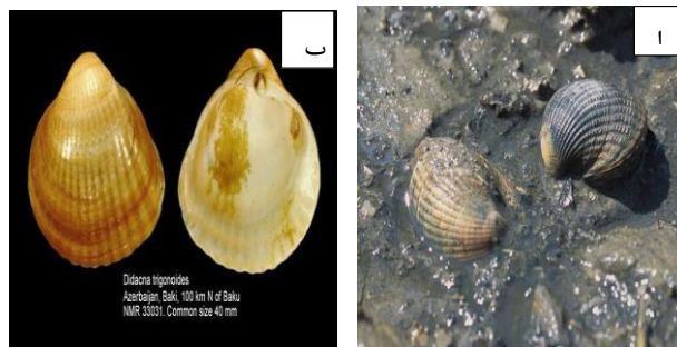
شکل ۱: (الف) صدف Cerastoderma و (ب) صدف Didacna (بیرشتین، ۱۳۷۹)

حداقل غلظت مهارکنندگی باکتری (The Minimum Inhibitory Concentration (MIC) توسط همولنف به‌وسیله روش ماکرودایلوژن سنجیده شد. بدین ترتیب که برای هر باکتری به‌طور مجزا از یک سری لوله‌های هشت‌تایی استفاده گردید و رقت‌های مورد نظر از همولنف در لوله‌های حاوی محیط مولر هینتون برات تهیه گردید. شش لوله برای رقت‌های مختلف همولنف و یک لوله به‌عنوان شاهد مثبت (محیط کشت برات + آنتی‌بیوتیک)، و یک لوله به‌عنوان شاهد منفی (محیط کشت برات + سرم فیزیولوژی) در نظر گرفته شد سپس به تمامی لوله‌ها به‌جز شاهد منفی ۱ میکرولیتر سوسپانسیون باکتری نیم مک فارلند اضافه و توسط سمپلر خوب باکتری را در محیط کشت مخلوط کرده و لوله‌ها به مدت ۲۴ ساعت در انکوباتور با دمای ۳۷ درجه قرار داده شد و آخرین لوله‌ای که هیچ‌کدورت رشدی در آن دیده نشد (بالاترین رقتی که کدورتی در آن مشاهده نشد) به‌عنوان حداقل غلظت بازدارندگی (MIC) انتخاب شد (Madhumathi، ۲۰۱۱). حداقل غلظت کشندگی باکتری (Minimum Bactericidal Concentration (MBC) توسط همولنف نیز سنجیده شد، بدین‌صورت که پس از تعیین MIC، از لوله‌هایی که فاقد کدورت بود مقدار ۱۰ میکرولیتر روی محیط مولر هینتون آگار، کشت داده شد. سپس در دمای ۳۷ درجه سانتی‌گراد به مدت ۲۴ ساعت انکوبه گردید. در صورت عدم تشکیل کلنی روی پلیت