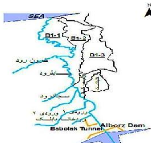
شکل ۱: نقشه موقعیت رودخانه های بابلرود و خرون رود

است (نصراللهی هریکنده و همکاران، ۱۳۹۰). رودخانه خرون رود یکی از منابع آبی در حوزه میانی بابلرود است که به آن می ریزد (شکل ۱) (مهتاب قدس، ۱۳۸۱) و این رودخانه علاوه بر تامین آب مورد نیاز کشاورزان، جذابیت های ویژه ای برای گردشگران را به وجود آورده است. در گذشته ماهیگیری در این رودخانه مرسوم بوده است که به مرور زمان و کم عمق شدن آن ماهی چندان در آن یافت نمی شود.