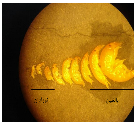
شکل ۱. اندازه‌های مختلف گاماروس پرورشی