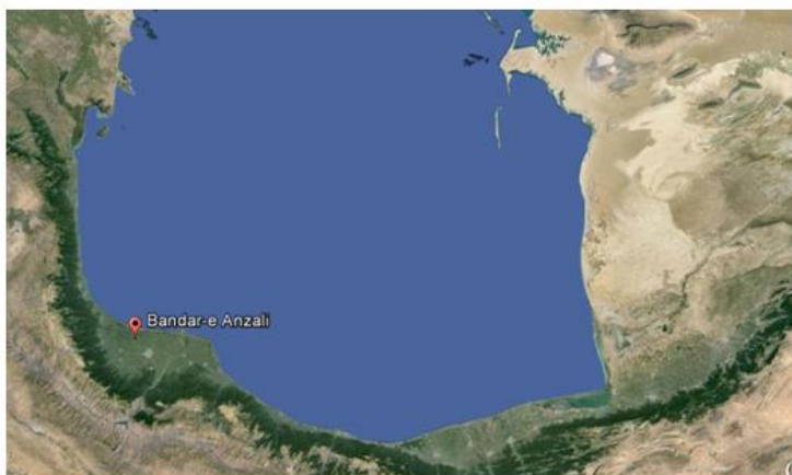
شکل ۱. نقشه منطقه مورد مطالعه و موقعیت بندر انزلی

کننده قرار داده شدند. محلول باقی‌مانده از هضم نمونه‌ها به بالن حجم سنجی ۲۵ میلی لیتری منتقل و پس از صاف کردن توسط کاغذ صافی ۴۲ میکرون شماره ۱، با آب مقطر به حجم ۲۵ میلی لیتر رسانده شد و با دستگاه جذب اتمی به روش کوره غلظت فلزات آن مورد سنجش قرار گرفت. در این پژوهش به خاطر نداشتن استاندارد مواد مرجع تایید شده (CRM)، از شیوه افزایش استاندارد استفاده شد و به این روش صحت نتایج دستگاه بررسی گردید. همچنین برای بررسی دقت داده‌ها، هر نمونه در سه تکرار انجام شد که مقادیر RSD پایین تر از ۵ درصد بود.