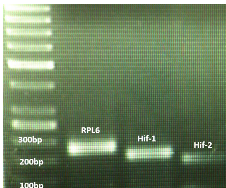
شکل ۱. اختصاصی بودن و اتصال صحیح ژن‌های هدف و رفرنس را نشان می‌دهد.

بیان نسبی ژن‌های هایپوکسی و hif-2 در تمام مراحل تکاملی (جنین تا ماهی جوان) فیل ماهی مورد بررسی قرار گرفت (شکل ۳، A و B). بیان ژن‌های مذکور با استفاده از ژن رفرنس RPL6 نرمال گردید، نتایج نرمال شده، وجود اختلاف آماری در بیان ژن‌های مذکور را در مراحل مختلف تکاملی نشان داد. پس از هج شدن لاروها، در سطح بیان دو ژن hif-1 (شکل ۳A) و hif-2 (شکل ۳B) افزایش نسبی مشاهده گردید که این افزایش تا مراحل انتهایی لاروی ادامه داشت. از لحاظ آماری میزان بیان ژن در مراحل مختلف تکاملی دارای اختلاف معنی‌داری بودند ( p < 0.05 ). سطح بیان ژن hif-1 از مرحله ۱۰ روز پس از هج شدن نسبتاً ثابت باقی ماند و این در حالی بود که سطح بیان ژن hif-2 بیست روز پس از هج شدن (همزمان به تغذیه خارجی) به طور معنی‌داری کاهش یافت.