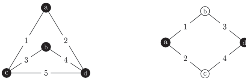
شکل (۵): شبکه‌ها با بردارهای علامت s_1 (سمت چپ) و s_r (سمت راست)

از آنجاکه s_1 \leq_{st} s_r ، با استفاده از قضیه ۴-۲ و با توجه به اینکه G یک توزیع DFR ( IFR ) است، داریم (Z_{N_1:N_1} \geq_{st} Z_{N_r:N_r}) Z_{1:N_1} \leq_{st} Z_{1:N_r} .