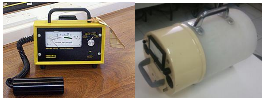
شکل (۲): سمت راست: دزیمر نوترون و سمت چپ:

در مرحله اول این تحقیق با استفاده از دزیمر گایگر-مولر و دزیمر نوترونی BF_3 مقادیر دز نوترون و گاما را در فواصل ۵، ۳۰ و ۱۰۰ سانتی متری را در جهات مختلف، جلو، عقب، راست، چپ، پایین و بالا اندازه‌گیری شده است (شکل ۲). سپس با استفاده از کد MCNPX نسخه ۲/۶ مقادیر دز در همان نقاط اندازه‌گیری و محاسبه شد [۵، ۴، ۳].