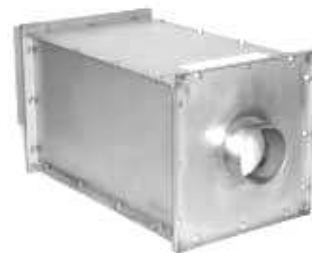
شکل ۲: فیلتر هپای بسته.

فیلترهای هپا ممکن است کاملاً داخل یک محفظه بسته از جنس چوب یا فلز بوده و دارای بوشن‌هایی در دو سر باشند، (شکل ۲). بدنه باید الزامات برای مقاومت در برابر هوای گرم و شعله را برآورده سازد.