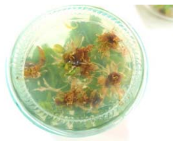
شکل ۲- نمونه هایی از گیاهچه های ریشه زا شده در محیط کشت

با دقت در جدول ۶ مقایسه میانگین اثر متقابل NAA × IBA، مشاهده می‌شود که در غلظتهای پایین هورمون