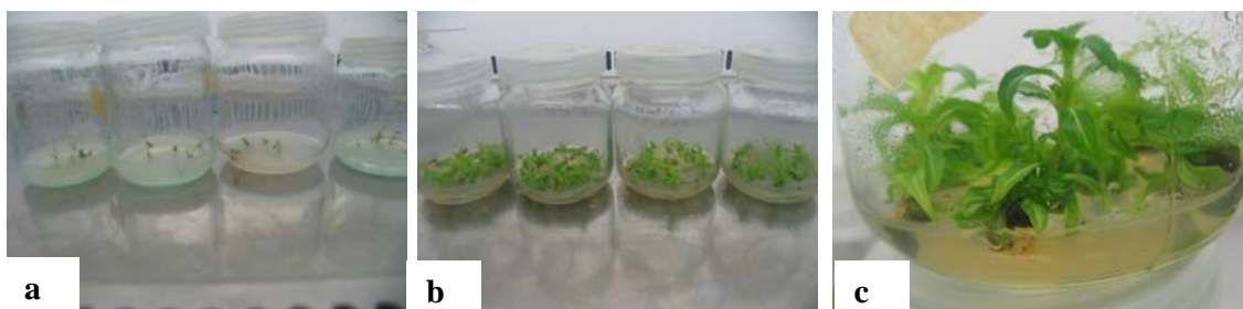
شکل ۱- مراحل اندام‌زایی گیاهچه‌ها از گره در محیط درون شیشه‌ای (a) در زمان کشت (b) پس از دو هفته (c) پس از شش هفته

سطوح مختلف هورمون NAA نیز با هم در سطح احتمال ( P \leq 0.01 ) اختلاف معنی‌داری داشتند و مقایسه میانگینها یک میلی گرم در لیتر NAA را دارای بالاترین بازده و ۰/۲۵ میلی گرم در لیتر NAA را دارای پایین‌ترین بازده نشان دادند. اثر متقابل هورمونهای BAP \times NAA در سطح ( P \leq 0.01 ) اختلاف معنی‌داری نشان دادند. مقایسه میانگینها (جدول ۴) ثابت کرد که ۰/۵ میلی گرم در لیتر NAA به