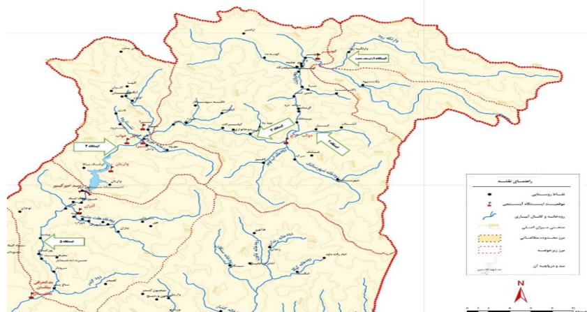
شکل ۱- نقشه رودخانه کرج (تهیه از شرکت مهندسی مشاور لار-۱۳۹۰)