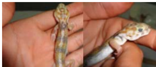
شکل ۱۶- کویر مرنجاب، خانواده اسفروداکتلیده، گونه

میلی‌متر ثبت شد (شکل ۱۶). مطالعه حاضر نشان می‌دهد که بین صفت پوزه تا مخرج و طول دم نمونه‌های کویر مرنجاب با نمونه‌های منطقه‌ی تپیک (سرچاه)، تفاوتی چندان وجود ندارد (۱۹). تعداد فلس‌های لب بالا در جنس نر ۲۳ الی ۲۶ عدد و برای جنس ماده ۲۴ الی ۲۶ عدد؛ بیشترین تعداد فلس‌های لب پایین ۲۱ عدد در بین نر و ۲۰ عدد در بین ماده‌ها ثبت شد. میانگین تیغه‌های زیر انگشت چهارم دست در نر ۲۴ و برای جنس ماده ۲۵؛ میانگین لاملای زیر انگشت چهارم دست در نر و ماده ۲۶؛ تعداد لاملای زیر انگشت چهارم پا در نر ۲۶ الی ۲۸ عدد و برای جنس ماده ۲۵ الی ۲۹ عدد شمارش شدند. محل نمونه تپیک این‌گونه در ایران، سرچاه واقع در استان خراسان می‌باشد (۱۹). رنگ زمینه پشتی نقش دار با خاکستری روشن، زرد، نارنجی، سایه‌های مختلف قهوه‌ای است و دو نوار طولی پهن قهوه‌ای تیره در زیر بدن، اما تا دم امتداد ندارند و بریده بریده‌اند؛ پهلوها و شکم مایل به صورتی تا سفید هستند. جوان‌ها زرد تیره تا نارنجی روشن با ۴ تا ۵ نوار عرضی دودی تا سیاه‌روی بدن که روی دم نیز همین نوارها را دارند (۹).