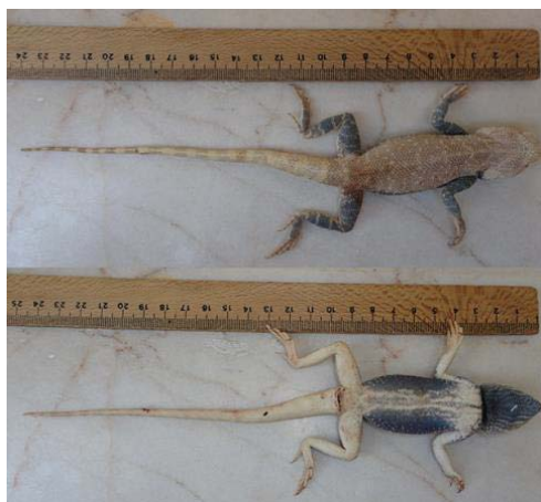
شکل ۳- کویر مرنجاب، خانواده آگامیده، گونه Trapelus agilis

۱. Trapelus agilis (Oliver 1804): بزرگترین نمونه اندازه‌گیری شده از T. agilis در این پژوهش دارای طول پوزه تا مخرج و طول دم به ترتیب ۹۶ و ۱۶۱ میلی‌متر در جنس نر و ۹۴ و ۱۶۰ میلی‌متر در جنس ماده است. میانگین طول دم در جنس نر ۱۵۶/۲ و در جنس ماده ۱۳۳/۵ میلی‌متر به دست آمد. این نشان می‌دهد طول دم در نرها بیشتر از ماده‌ها است (شکل ۳). رستگار پویانی و همکاران (۱۳۸۶) طول پوزه تا مخرج T. agilis را ۱۱۵ میلی‌متر و طول دم را ۱۷۷ میلی‌متر گزارش دادند (۹). در حالی‌که یاری (۱۳۸۹) و بهمنی (۱۳۹۰) به ترتیب در کرمانشاه و کردستان اندازه طول پوزه تا مخرج را ۹۴/۵ تا ۱۵۴ میلی‌متر و ۱۷۵،۶ تا ۱۴۴ میلی‌متر گزارش دادند (۳ و ۱۶). از نظر پراکنش با دو گونه دیگر خانواده آگامیده در ناحیه مورد مطالعه همپوشانی دارد. این گونه در روزهای آفتابی بیشتر دیده می‌شود و مطالعات نشان می‌دهد که از حشرات، عنکبوتیان، هزارپایان و گاهی از مواد گیاهی تغذیه می‌کنند (۳).