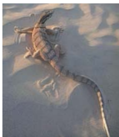
شکل ۱۷- کویر مرنجاب، خانواده وارانیده، گونه

۱. Varanus griseus (Daudin, 1803) : طول نوک پوزه تا مخرج ۶۰۰ میلی‌متر و طول دم ۹۰۰ میلی‌متر اندازه‌گیری شد (شکل ۱۷). در نواحی بیابانی و نیمه بیابانی، زمین‌های ماسه‌ای با سطوح ناهموار، خاک‌های رستی، در دامنه کوه‌ها، تپه‌ها و دشت‌ها با پوشش گیاهی استپی زندگی می‌کند و معمولاً از مناطق با پوشش درختی دوری می‌کند. سرعت بالایی دارد و در زمان تعقیب شدن بسرعت فرار می‌کند. این‌گونه روز فعال است و فعالیت خود را از ساعات اولیه روز آغاز می‌کند. از لانه‌های زیرزمینی پستانداران و سایر جانوران بعنوان پناهگاه استفاده می‌کنند و یا خود لانه حفر می‌کند.