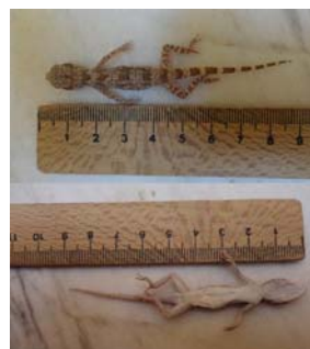
شکل ۶- کویر مرنجاب، خانواده جکونیده، گونه

۱. Bunopus crassicaudus (Nikolsky 1907) : بیشترین طول پوزه تا مخرج در نمونه‌های جمع‌آوری‌شده از کویر مرنجاب ۵۱ میلی‌متر و بیشترین طول دم ۴۶ میلی‌متر اندازه‌گیری شد که با نمونه‌های استان قم و اراک تفاوت چندانی نشان نداده است (شکل ۶). در نمونه‌ی ایرانی طول پوزه تا مخرج ۵۴ میلی‌متر و طول دم ۵۶ میلی‌متر گزارش شده است (۱۹). این‌گونه که از ضلع جنوب غربی دریاچه نمک جمع‌آوری شد. در ایران بانام فارسی جکوی دم کلفت زگیل‌دار شناخته می‌شود و محل نمونه تیپیک از قم گزارش شده است (۹). این نمونه شب‌ها فعالیت می‌کنند و زیر سنگ‌ها شکاف‌ها و غیره مخفی می‌شوند و از حشرات و عنکبوت‌ها تغذیه می‌کنند (۹). زیستگاه‌های این‌گونه در استان اصفهان با منطقه تیپیک مطابقت دارد.