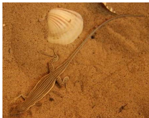
شکل ۱۲- کویر مرنجاب، خانواده لاسرتیده، گونه Eremia fasciata

۳۶ عدد و برای جنس ماده ۲۶ الی ۳۲ عدد شمارش گردید. محل نمونه تیپیک از ایران، ۴۰ تا ۴۵ کیلومتری شرق دریاچه نمک، دشت کویر واقع در استان سمنان می‌باشد (۹). سوسمار مذکور در نواحی بیابانی و نیمه بیابانی خشک، در دامنه‌های دشتی، با زمین‌های ماسه‌ای، نمکی، رسوبی یا ریگزار همراه با گیاهان پراکنده بیشتر از نوع بوته‌ای کوچک، و همچنین بناهای مخروبه یافت می‌شود. این گونه روزها فعالیت می‌کند. درون حفره‌های ماسه‌ای مخفی می‌شود و از بندپایان مختلف تغذیه می‌کنند. از نظر رنگ‌آمیزی شباهت زیادی با گونه E. andersoni دارد.