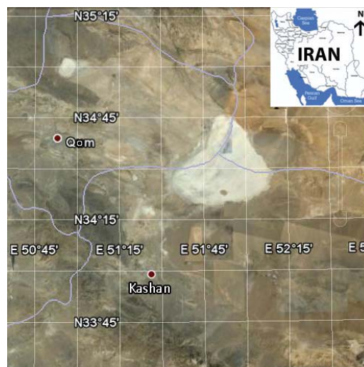
شکل ۱- موقعیت منطقه نمونه‌برداری واقع در کویر مرنجاب

منطقه مورد مطالعه: کویر مرنجاب با مختصات 50^{\circ}45' طول شرقی و 35^{\circ}15' عرض شمالی در شمال شهرستان آران و بیدگل استان اصفهان قرار دارد. این کویر از شمال به دریاچه نمک آران و بیدگل، از غرب به کویر مسیله و دریاچه‌های نمک حوض سلطان و حوض مره، از شرق به کویر بندریگ و پارک ملی کویر و از جنوب به شهرستان‌های آران و بیدگل و کاشان محدود می‌شود (شکل ۱). ارتفاع متوسط کویر مرنجاب از سطح آب‌های آزاد حدود ۸۵۰ متر می‌باشد. قسمت عمده این کویر پوشیده از تپه‌های شنی و ریگزار است. کویر مرنجاب از نظر پوشش گیاهی بسیار غنی است و گیاهان آن را عمدتاً گونه‌های شور پسند از جمله گز، تاق و قیچ تشکیل می‌دهند که علاوه بر جلوگیری از فرسایش و حفظ خاک نمادی از استقامت در گرمای کویر هستند. دمای هوا در این منطقه در تابستان به حدود 50^{\circ}C نیز می‌رسد (۱۱).