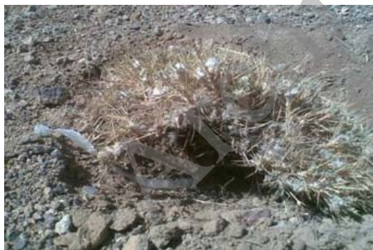
شکل ۱- صمغ ترشح شده از گون سفید پس از سه روز از زمان تیغ‌زنی ساقه

روابط بسیار مفید بود. بعد از چهار روز میزان صمغ هر گون باتوجه به سن گیاه (۳) و مرتبه برداشت (پرشش از بهره‌برداران) در سالهای قبل با استفاده از ترازوی دیجیتال دیامند مدل A04 با دقت ۰/۱ گرم در پای هر بوته اندازه‌گیری و ثبت گردید. به دلیل اثر تراکم بر روی محصول تولیدی در محل نمونه‌گیری در سه تیپ گیاهی، مکان‌هایی انتخاب گردید که تراکم گون‌ها مشابه باشد که این امر با استفاده از خط‌کش تی انجام شد. همچنین به منظور نمونه‌گیری از خاک در هر تیپ گیاهی، در ابتدا و انتهای هر کدام از ترانسکت‌ها پروفیل خاک حفر گردید و با توجه به عمق خاک موجود، جمعاً ۴۸ نمونه خاک برداشت شد. فاکتورهای مهم فیزیکی و شیمیایی نمونه‌های خاک از جمله درصد سنگریزه، بافت، اسیدیته، هدایت الکتریکی، ماده آلی، ازت و پتاسیم اندازه‌گیری شد. اطلاعات بدست آمده از میزان صمغ تولیدی گیاهان با استفاده از نرم‌افزار SPSS (۱۷) تجزیه و تحلیل و به روش همزمان (Enter) وارد رابطه رگرسیونی گردیدند. همچنین اطاعات مربوط به خاک سه تیپ گیاهی نیز با استفاده از نرم‌افزار PC-ORD (۴) به منظور مشخص نمودن تفاوت‌ها مورد تجزیه قرار گرفتند.