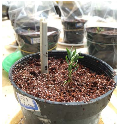
شکل ۴- مرحله استقرار نمونه‌ها در گلدان و در شرایط گلخانه (ژنوتیپ شماره ۱).

لازم بذکر است که در تکثیر رویشی گونه‌های جنگلی از طریق ریزازدیادی همیشه این نگرانی وجود داشته است که تنوع ژنتیکی گونه‌ای که تکثیر می‌شود کاهش یابد و