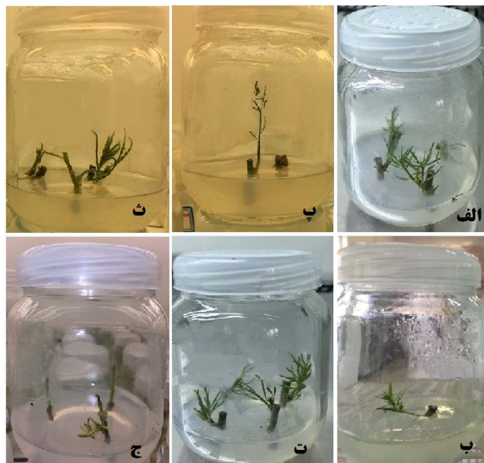
شکل ۱ - کشت سرشاخه‌های سه ژنوتیپ متفاوت بادام کوهی در محیط کشت DKW پس از ۶۰ روز؛ ژنوتیپ ۱: الف و ب، ژنوتیپ ۲: پ و ت، ژنوتیپ ۳: ج و د.

هورمون‌پاشی و ۵ روز پس از هورمون‌پاشی، کمترین تعداد جوانه (به ترتیب ۱/۳ و ۱/۵ عدد) را ایجاد کرد (شکل ۲). ژنوتیپ‌های ۱ و ۲، از نظر تعداد جوانه، میانگین عمومی بیش از ژنوتیپ ۳ داشتند (جدول ۳).