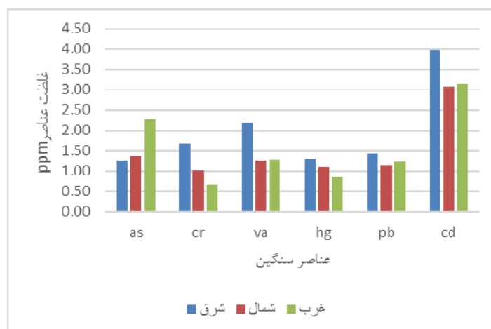
شکل ۲- مقایسه‌ای تغلیظ زیستی عناصر در سه جهت اصلی حومه پالایشگاه

مقایسه مقدار ضریب تغلیظ زیستی از خاک به اندام‌های هوایی پنیرک نشان داد که بیشترین میزان آن به ترتیب مربوط به کادمیوم، آرسنیک، وانادیوم، سرب، کروم و جیوه می‌باشد. بطور کلی هر چه مقدار غلظت فلزات در خاک بیشتر باشند به همین ترتیب، جذب آن توسط گیاه افزایش پیدا می‌کند. بر اساس این مطالعه، غلظت فلزات در گیاه