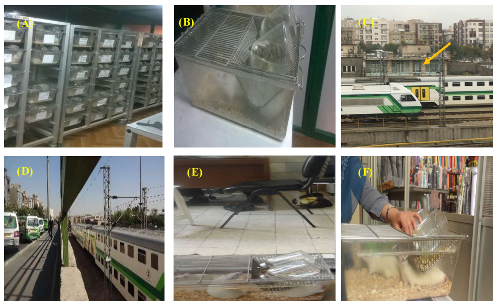
شکل ۱- A-B. محل نگهداری گروه کنترل. C. محل ساختمان اداری رز غربی (اطراف ایستگاه مترو صادقیه. D. خیابان رز غربی. E. گروه تجربی در ساختمان اداری رز غربی. F. گروه تجربی در بازار بزرگ تهران.

Fig. 1. A-B. Control groups. C. West Rose office building location (in the vicinity of Sadeghiyeh metro-station). D. West Rose Street. E. Experimental groups located in West Rose building. F. Experimental groups located in the Tehran Grand Bazaar.