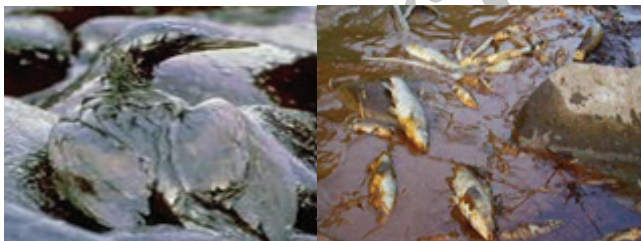
شکل ۱ | موجودات زنده در معرض آلودگی نفتی

پیشرفته استفاده نمی‌کنند، به دریای خزر تحمیل می‌شود. از سوی دیگر خلیج فارس و نواحی اطراف آن نیز از این آلودگی‌ها در امان نمانده‌اند. طبق نظر دکتر اسماعیل کهرم، متخصص محیط زیست، خلیج فارس ۴۷ برابر آب‌های آزاد آلودگی دارد که ناشی از انواع فعالیت‌های نفتی و صنعتی است، ورود آب توازن یکی از سرمنشاهای اصلی آلودگی در خلیج فارس است. این مشکلات تنها به ایران ختم نشده و ما همواره اخباری ناگوار در این موارد از سراسر جهان به گوشمان می‌رسد، مانند انفجار به خاطر حفاری در منطقه ساحلی در ماه آوریل ۲۰۱۰ در خلیج مکزیک که منجر به شکل‌گیری بدترین لکه نفتی در تاریخ آمریکا شد. آلودگی آب‌های خلیج مکزیک باعث تلف شدن بیش از ۶۰۰۰ پرنده و ۶۰۰ لاک‌پشت گردید [۲]. بسیاری از آبزیان و موجودات زنده در معرض خطر این آلودگی‌ها می‌باشند و می‌توانند وارد زنجیره غذایی شوند (شکل ۱).