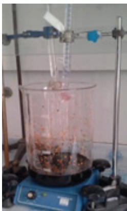
شکل ۲ | سنتز نانوذرات اکسید آهن

در این پژوهش از نسبت ۱ به ۲ سولفات آهن هفت آبه به کلرید آهن شش آبه در ۱۵۰۰ میلی لیتر آب مقطر استفاده شد و بر روی استیرر با مگنت ۵ سانتی متری به سرعت حل شدند. در ادامه ابتدا pH محلول اندازه گیری شد و برای ایجاد شرایط قلیایی از آمونیاک استفاده گردید. سپس جهت جلوگیری از زیاد شدن زمان واکنش، به کمک دو بورت که در کنار هم چیده شده بودند، افزایش آمونیاک ۴ مولار به آرامی انجام شد. بورت ها طوری تنظیم شدند که قطرات هر دو بورت در مرکز دوران مگنت وارد شوند و همچنین قطرات به صورت متوالی چکیده شوند (شکل ۲).