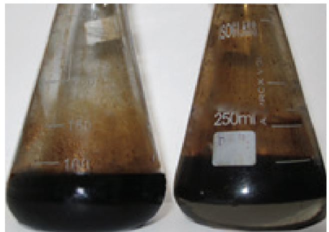
شکل ۵ | ارلن سمت راست نمونه مورد مطالعه است که جدایش نفت از آب را توسط نانوذرات مگنتیت نشان می‌دهد. ارلن سمت چپ نمونه شاهد است که جدایش مناسبی در آن صورت نگرفته است.