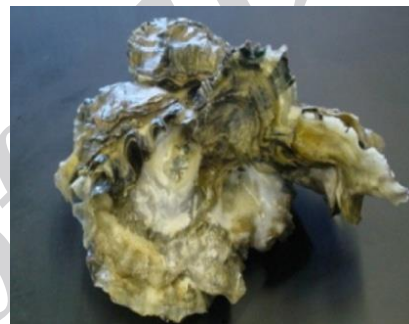
شکل ۱ نمای مورفولوژیک دوکفه‌ای Crassostrea gigas

نمونه‌های آب دریا و دوکفه‌ای Crassostrea gigas در اسکله بهمن قشم جمع آوری قرار گرفتند (شکل ۱). نمونه آب دریا از عمق ۱۵ cm و دوکفه‌ای نیز از مناطق ساحلی که احتمال حضور نفت وجود داشت از عمق ۱۰ الی ۱۵ متری به وسیله غواصی در ظروف استریل جمع‌آوری و روی یخ به آزمایشگاه منتقل شد. نمونه‌ها در دمای 4^{\circ}\text{C} تا انجام آنالیزهای بعدی قرار داده شدند. برای تعیین میزان تراکم و تنوع باکتری، از سطوح درونی دوکفه‌ای‌ها در آزمایشگاه نمونه‌برداری صورت گرفت [۷].