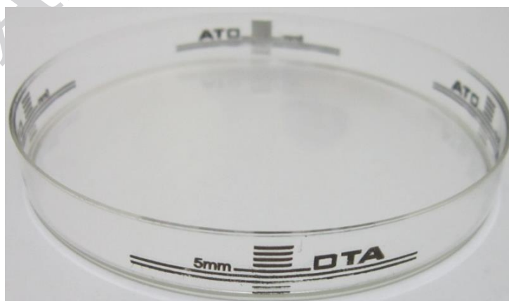
شکل ۱ دو خط بلند جهت تعیین ضخامت استاندارد محیط کشت طبق CLSI