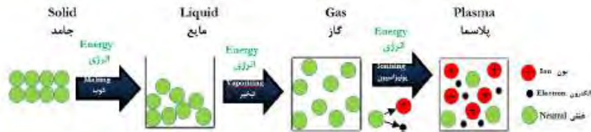
شکل ۱ پلاسما به عنوان حالت چهارم ماده [۱۵].

گفته می‌شود ۹۹٪ ماده موجود در طبیعت در حالت پلاسماست. این برآورد تخمین معقولی است از این واقعیت که درون ستارگان و اتمسفر اطراف آن‌ها ابرهای گازی و نیز فضای بین ستارگان اغلب به صورت پلاسماست. در نزدیکی خود ما، هنگامی که جو زمین را ترک می‌کنیم، بلافاصله با پلاسمایی مواجه می‌شویم که شامل کمربندهای تشعشعی وان آلن و بادهای خورشیدی است. با نگاهی به زندگی پیرامونمان می‌توانیم نمونه‌های متنوعی از پلاسما را بیابیم: جرقه رعد و برق، تابش ملایم شفق قطبی، گازهای داخل یک لامپ فلورسنت یا لامپ نئون و یونش و لامپ مهتابی؛ مختصری که در گازهای خروجی موشک دیده می‌شود.