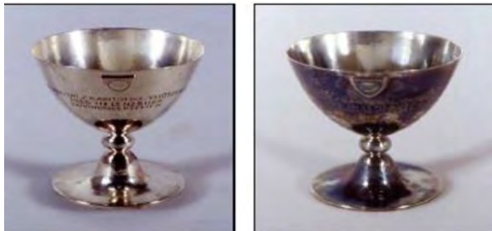
شکل ۲ تصاویری از جام نقره‌ای قبل و بعد از استفاده از پلاسما هیدروژن به مدت دو ساعت و نیم [۱۶].

مزایای استفاده از پلاسما، تأثیر مثبت در تسهیل پاکسازی مکانیکی و تسریع نمک‌زدایی بعدی با سولفیت قلیایی برای آثار آهنی باستانی و همچنین قابلیت پلاسما هیدروژن در احیاء لایه‌های سولفید نقره بود، بدون آنکه تغییری در ساختار سطح یا تداخلی در اطلاعات موجود در فلزکاری باستانی ایجاد کند.