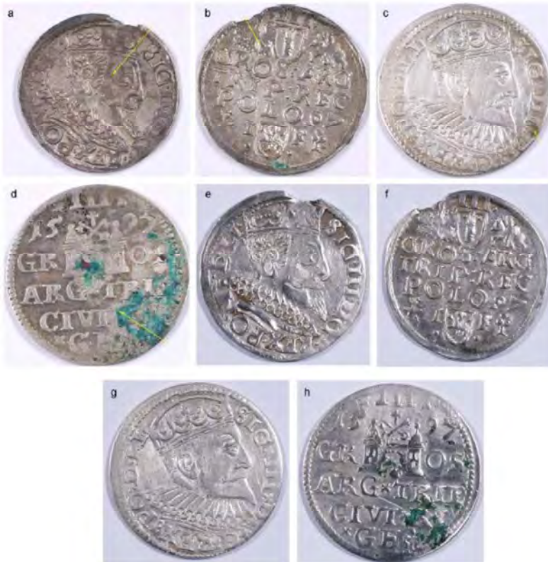
شکل ۳ تصاویر عکاسی قبل از مرمت (آدی) و بعد از مرمت (ای‌اچ) با پلاسمای اچ اف.

می‌دهد. با توجه به نتایج اولیه، به نظر می‌رسد که ماهیت ترکیب گاز، پارامتر مهمی در فرایند ضد عفونی کردن نیست. همان گونه که با افزایش درصد اکسیژن از صفر به ۵٪ و ۲۴٪، تفاوت زیادی مشاهده نشد. با وجود این، تأثیر پارامترهایی مانند زمان مرمت و ترکیب گاز باید بیشتر بررسی شود.