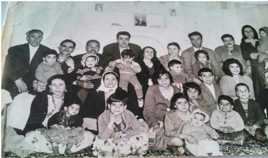
عکس شماره ۴، سال ۱۳۳۹

زمینه پوشش افراد می‌توان گفت که در عکس‌هایی که مربوط به سال‌های نخست پهلوی اول و دوم در میان افراد مسن و سال خورده، در برابر کشف حجاب و تغییرات پوششی مقاومت نشان داده‌اند. کشف حجاب در دوره پهلوی اول (۱۳۱۴) و یک‌شکلی لباس‌ها، تغییر در کلاه مقوایی، جایگزین شدن کلاه پهلوی و سپس کلاه شاپو، استفاده از پیراهن‌های یقه‌دار در عوض پیراهن یقه‌گرد، استفاده از کفش چرم و درنهایت، استفاده از کلاه پهلوی، کت و دامن در میان زنان و برداشته شدن پوشش‌های قاجاری، در عکس‌ها نمایان است. دیگر این‌که، کالاهای خارجی مورد مصرف افراد قرار گرفته‌اند. در باب رمزگان سطح سوم و چهارم، یعنی نگاه و ژست افراد و فضاهای عکس‌برداری، تا اواخر دوره پهلوی، انعطافی در چهره و رفتار افراد دیده نشده است. عکس‌هایی که فضای داخلی خانه و محیط بیرون (پارک و...) گرفته شده‌اند، انعطاف در حالت رفتاری افراد را نشان می‌دهد. استفاده از مکان‌های عمومی، نشانه آشنایی مردم با عکاسی و حوزه عمومی، رواج یافتن آن در بین قشر عامه، هم‌چنین پیشرفت در دوربین‌های کوچک و فلاش‌دار را بازنمایی می‌کند. شکل‌گیری طبقه‌ی متوسط نیز در این دوره دیده می‌شود.