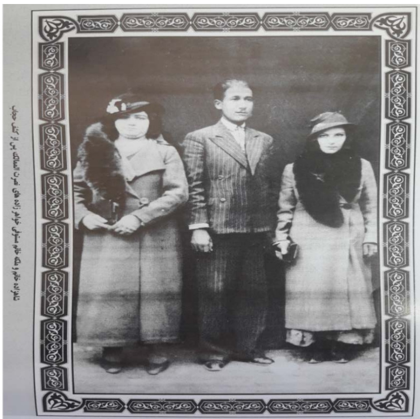
عکس ۳. سال ۱۳۲۰ ه.ش. کشمیری (۱۳۸۹).