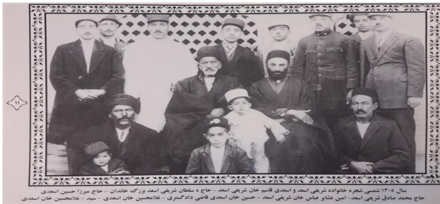
عکس ۲. سال ۱۳۰۵ ه.ش. کشمیری (۱۳۸۹).