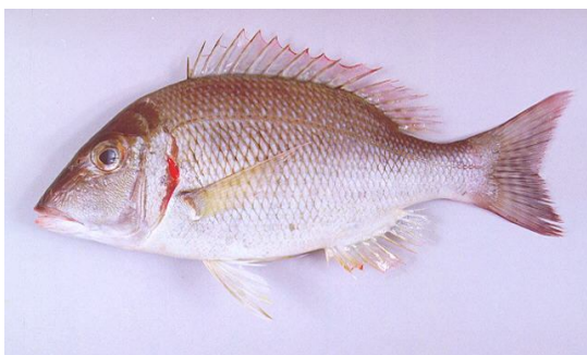
نگاره ۱- ماهی شهری گوش قرمز Lethrinus lentijan

تاریخ دریافت: ۹۲/۲/۱۲ تاریخ پذیرش: ۹۲/۳/۲۷