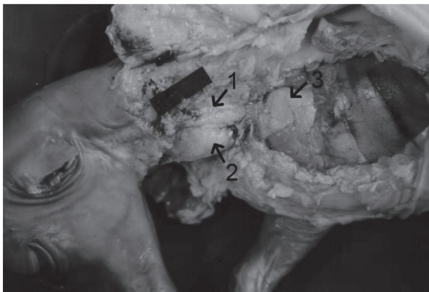
شکل ۱- جنین گوسفند در سن نیمه اول ماه چهارم. ۱- بخش گردنی سمت چپ. ۲- بخش گردنی سمت راست. ۳- بخش سینه ای.

ضخامت تیغه های همبندی بین قطعه چهی از ماه دوم تا انتهای دوره جنینی کاهش نشان داد (جدول ۱). میانگین ضخامت قطعه چه های تیموس در ماه پنجم در ناحیه گردنی به طور معنی دار بیش از ناحیه سینه ای بود ( P < 0.05 ) و میانگین ضخامت بخش های