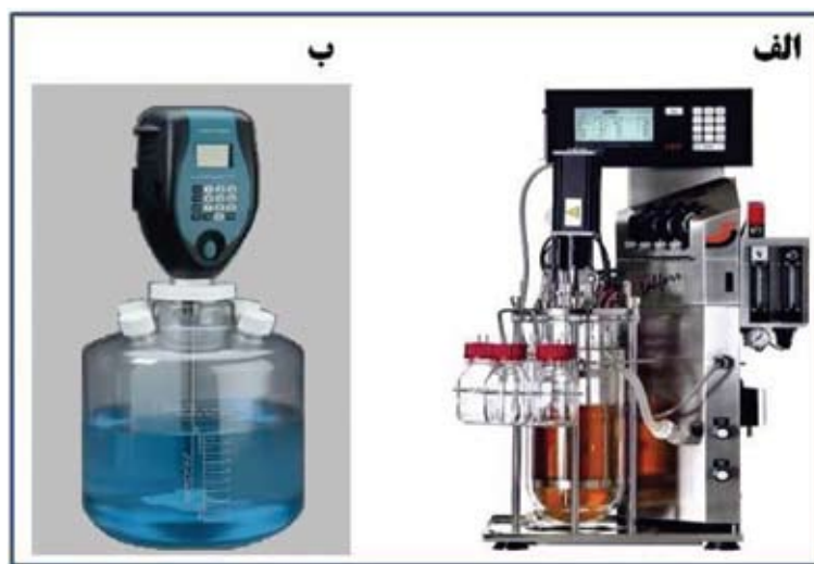
شکل ۲- بیوراکتورهای مورد استفاده در کشت سلول های رده سلولی آلوده به شیزونت تیلریا آنولاتا. الف. بیوراکتور هوازی شرکت Labfors با امکانات کامل حسگرها و کنترل کننده های مختلف حین رشد و نمونه برداری لازم، در حجم ۸ لیتر مورد استفاده قرار گرفت. ب. ظرف نیمه پیشرفته Biomixer، جهت کشت سلول های آلوده به شیزونت تیلریا در حجم ۲۰ لیتر با سیستم الکترونیکی جهت کنترل مخلوط سازی محیط کشت و سلول.

کشت در ظروف ساده ولف: در ابتدا بذر مناسب از سلول های رشد یافته، جهت کشت در بطری های ساده کشت سلولی بنام ولف با محیط استوکر و با هوادهی و عمل همزدن بکار برده شد. گرمای لازم جهت انکوباسیون سلول ها توسط منبع مولد گرما با نام "ترمومیکسر" فراهم