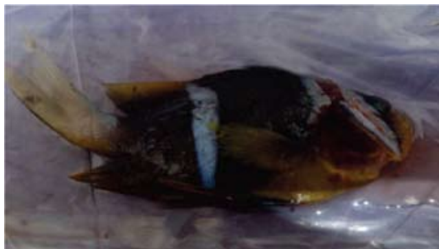
شکل ۱- دلقک ماهی آلوده به انگل آمیلوودینیوم اسلاتوم

انگل وارد شده با ماهی آکواریومی ممکن است خطرات جدی برای ماهیان بومی و صنعت آبی پروری کشور ایجاد نماید. لذا لازم است ماهیان وارداتی مرحله کامل قرنطینه را طی نموده و در صورت مشاهده هر گونه علائم ظاهری و رفتاری مورد بررسی قرار گیرند. (Levy, M.G. 2006) - (Noga, E.J. 2012 و Noga, E.J.)