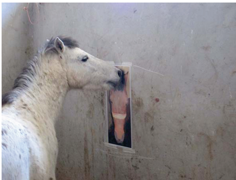
شکل ۶- باکس اول

در باکس شماره دو که تصاویر اسبچه در حالات عصبی بصورت چهار گوش و فازی نصب شده بود، هیچیک از اسبچه‌ها به سمت تصویر فازی توجهی نشان ندادند. فقط اسبچه شماره ۶ (دو بار) و اسبچه‌های شماره هفت و هشت (یک بار) به سمت تصویر چهار گوش رفتند. سایر اسبچه‌ها توجهی به این تصویر نداشتند. در باکس شماره سه که تصاویر اسبچه آرام و اسبی از نژاد دیگر (سفید