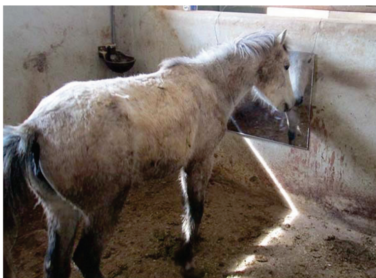
شکل ۷- باکس چهارم