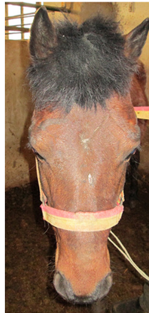
شکل ۳- حالت روحی نرمال و طبیعی حیوان

ب) حالت روحی خشمگین و تهاجمی با گوش‌های خوابیده (شکل ۴) ج) حالت روحی نرمال و طبیعی حیوان بصورت مات و شطرنجی شده (Phasi)