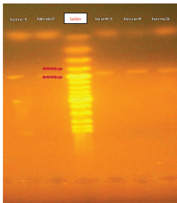
شکل ۳- نمونه‌های مورد آزمایش L1 تا L5 دارای باند با طول 704bp برای ژن hlb