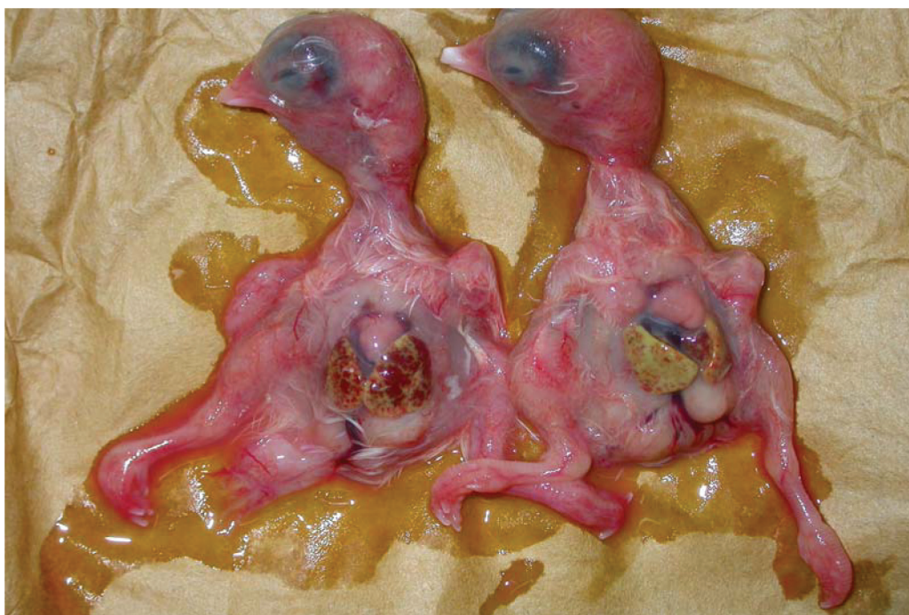
شکل ۲- در هر دو جنین ضایعات به صورت قلب نیمه پخته، نکروز وسیع کبد و خونریزی گسترده روی جنین مشاهده می شود.

شد. چندین گزارش از جداسازی و شناسایی این ویروس ها در کشور وجود دارد (۱، ۲، ۱۵، ۱۰، ۲۰۲۲). ظهور سویه های بسیار حاد ویروس بیماری بروس عفونی (vvIBDV) در اواخر دهه ۸۰ در اروپا و گسترش سریع آن به آسیا در اوایل دهه ۹۰ چالش جدید و جدی در مقابل برنامه واکسیناسیون موجود قرارداد (۱۱ و ۱۲ و ۲۴). ظهور دوباره ی فرم های واریانت یا بسیار حاد متعاقب با شکست واکسیناسیون علت اصلی ضررهای اقتصادی عمده وارد شده به صنعت پرورش طیور است. با ظهور سویه های بسیار حاد، واندنبرگ و همکاران (۱۹۹۱) و واندنبرگ (۲۰۰۰) گزارش دادند که این سویه ها قادرند سد ایمنی مادری را بسیار زودتر از سویه های کلاسیک حاد و البته سویه های متوسط واکسن شکسته و باعث ضایعات و مرگ و میر پس از آن در سطح گله شوند (۵ و ۲۶). همچنین فاراگر و همکاران (۱۹۷۴) گزارش کرده اند، اثر سرکوب ایمنی در سنین پایین تر از سنین بالاتر شدیدتر است (۱۴). نانویا و همکاران نیز گزارش کردند که به علت انتشار ویروس های بسیار حاد بیماری بروس عفونی در ژاپن و آلودگی گله ها به این ویروس ها، بروز نیوکاسل حاد و آلودگی های باکتریایی گسترده قابل توضیح است (۷). تکثیر قطعات ژنتیکی یک ویروس ناشناخته به کمک پرایمرهای اختصاصی و با روش PCR می تواند هویت آن ویروس را مشخص کند. در این مطالعه با استفاده از پرایمرهای اختصاصی محصولات PCR ۶۴۳ جفت بازی (bp)