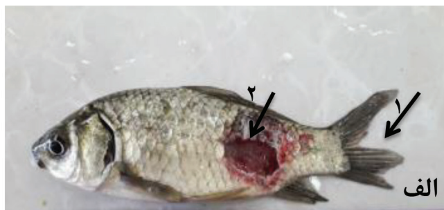
شکل ۱- نمونه‌ای از ماهی‌های آلوده صید شده از شازده رود: الف: ۱) پوسیدگی باله دم و از بین رفتن حالت چنگالی آن (۲) زخم پوستی شدید که تا سطح عضلات را نیز درگیر کرده است. ب: بزرگ شدن و پرخونی کلیه‌ها.