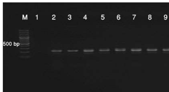
شکل ۱- نتایج آزمون PCR ژن mecA (۱۶۳ جفت باز) برای تعدادی از جدایه‌های استافیلوکوکوسی مورد مطالعه؛ ستون M: نشانگر ۱۰۰ bp، ستون ۱: کنترل منفی، ستون‌های ۳-۹: نمونه‌های مورد بررسی.

در روش مولکولی از مجموع ۴۲ جدایه تأیید شده در روش‌های فنوتیپی به عنوان استافیلوکوکوس اورئوس، تعداد ۳۸ (۹۱/۵۶ درصد) جدایه ژن femA (شکل ۱- و تعداد ۲۲ (۵۲/۳۸ درصد) جدایه از آن‌ها ژن mecA داشتند (شکل ۲-).