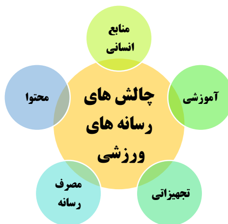
شکل ۱. مدل مفهومی پژوهش

حالت ساختاری و شکل ۳ مدل پژوهش را حالت ضرایب تی را نشان می‌دهد.