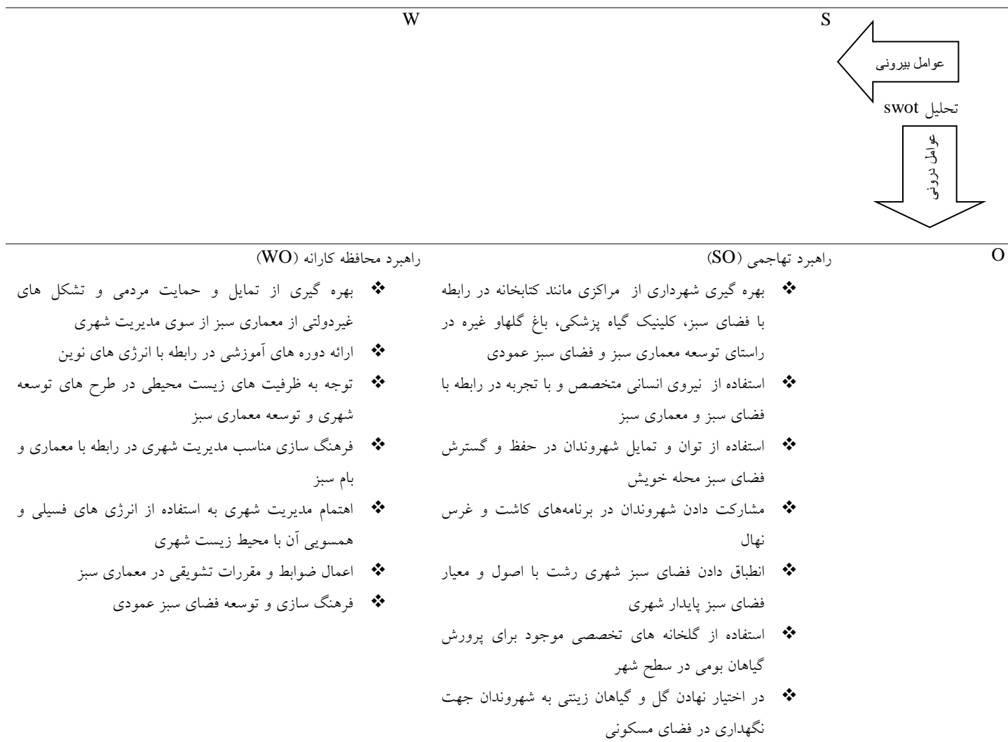
جدول ۵: تحلیل راهبردهای سوات

قرار می دهند. استخراج راهبردهای ممکن از طریق ماتریسی که از تقابل و تعامل عوامل درونی و بیرونی شکل می یابد، صورت می گیرد. این ماتریس در جدول (۵) ارائه شده است.