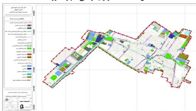
شکل ۲. نقشه کاربری اراضی شهر بادرود