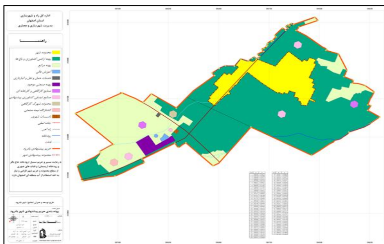
شکل ۳. پهنه بندی حریم شهر بادرود