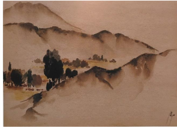
شکل ۵. راست: آبدی، ۱۳۵۷، آبرنگ روی کاغذ، ۳۵/۵ در ۲۵/۵ سانتیمتر، از مجموعه خانواده سپهری.