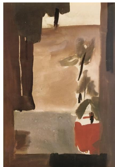
شکل ۳. راست: گلدان و پنجره، میانه دهه ۱۳۵۰، گواش روی کاغذ، ۲۴ در ۳۳/۵ سانتیمتر، از مجموعه خانم و آقای کازرونی. شکل ۴. چپ: سرخ تپنده، حدود ۱۳۴۲، ۳۴ در ۴۹ سانتیمتر، از مجموعه خانم لیلی گلستان.