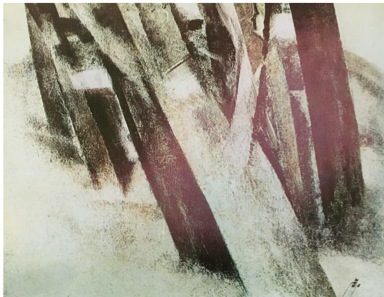
شکل ۱. راست: عنوان نامعلوم، ۱۳۴۸، رنگ روغن روی بوم، ۴۰/۵ در ۵۱ سانتیمتر. شکل ۲. چپ: تنه های اریب، حدود ۱۳۵۰، رنگ روغن روی بوم، ۱۲۰ در ۸۰ سانتیمتر، موزه هنرهای معاصر تهران.