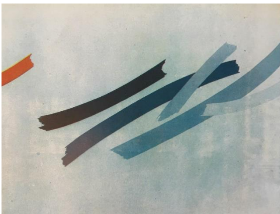
شکل ۶. چپ: عنوان نامعلوم، ۱۳۵۶، رنگ روغن روی بوم، ۹۶ در ۱۲۹ سانتیمتر.