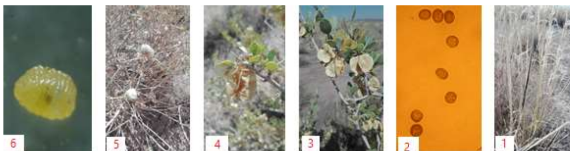
شکل ۱- علائم سیاهک استپی ریش‌دار (۱)، تلیوسپور سیاهک استپی ریش‌دار (۲)، علائم خسارت بذرخوار قبیج (۳ و ۴)، گال ایجادشده در گیاه درمنه Artemisia aucheri (۵) و لارو مگس خانواده Cecidomyiidae (۶)