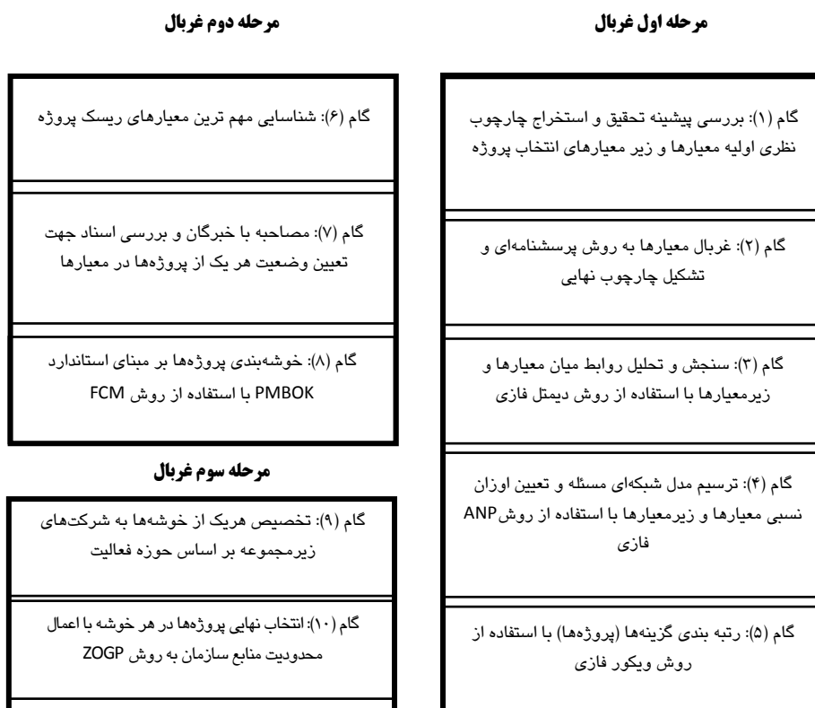
شکل ۱ فرآیند اجرای پژوهش

تصمیم‌گیرندگان معمولاً در فرآیند تصمیم‌گیری با ابهامات، تردیدها و عدم قطعیت مواجه هستند. برای رفع ابهام و ذهنی بودن قضاوت تصمیم‌گیرنده و همچنین بیان واژه‌های کلامی در فرآیند تصمیم‌گیری، نظریه فازی مطرح شد [۲۵]. بر این اساس، پژوهش‌های فراوانی در این خصوص انجام گرفته است، اما تعداد بسیار کمی از این مطالعات قادر به انعکاس ابهامات موجود در تفکرات و تصمیمات کارشناسان هستند. از آنجاکه منطق فازی دلالت بر تفسیر شرایط مبهم و تصمیم‌گیری در شرایط عدم قطعیت دارد، لذا پژوهش حاضر درصدد پر کردن شکاف مزبور با ارائه روش‌شناسی مبتنی بر فنون تصمیم‌گیری چندمعیاره تحت شرایط عدم قطعیت است. همچنین جهت