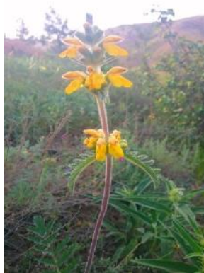
شکل ۱: گیاه E.labiosiformis

برای تعیین آستانه سمیت سلولی عصاره متانولی E.Labiosiformis با روش MTT، سلول‌های Vero به تعداد مناسبی (۶۰۰۰ سلول/چاهک) در میکروپلیت ۹۶ خانه‌ای کشت داده شدند آنگاه به مدت ۲۴ ساعت در گرمخانه ۳۷ درجه سانتیگراد و ۵٪ CO 2 قرار گرفتند تا تک لایه سلولی تشکیل گردد. سپس از گرمخانه خارج و در زیر هود، غلظت‌های مختلف عصاره متانولی E.labiosiformis (۲۰۰۰، ۱۰۰۰، ۵۰۰، ۲۵۰، ۱۲۵، ۶۲/۵، ۳۱/۲۵ میکروگرم/ میلی‌لیتر) به سلول‌ها افزوده گردید. چاهک‌های کنترل نیز شامل کنترل سلول که محتوی سلول و محیط کشت کامل و کنترل بلانک که بدون سلول و محیط کشت کامل است تعیین و میکروپلیت‌ها تا زمان‌های مورد نیاز (۷۲-۴۸-۲۴ ساعته) مجدداً در گرمخانه ۳۷ درجه سانتیگراد و ۵٪ CO 2 قرار گرفتند. بعد از طی زمان‌های مورد آزمایش، سلول‌ها با فسفات سالین PBS شستشو شدند رنگ MTT به