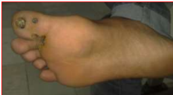
شکل ۱. نمای گروس ضایعه مولوسکوم کانتاجیزیوم

بیماری‌های منتقله از راه جنسی نداشت و سابقه‌ای از مصرف دارو را نیز ذکر نمی‌کرد. ضایعه مشابهی در اعضای خانواده بیمار نیز وجود نداشته است.